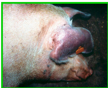
Cyanose auriculaire